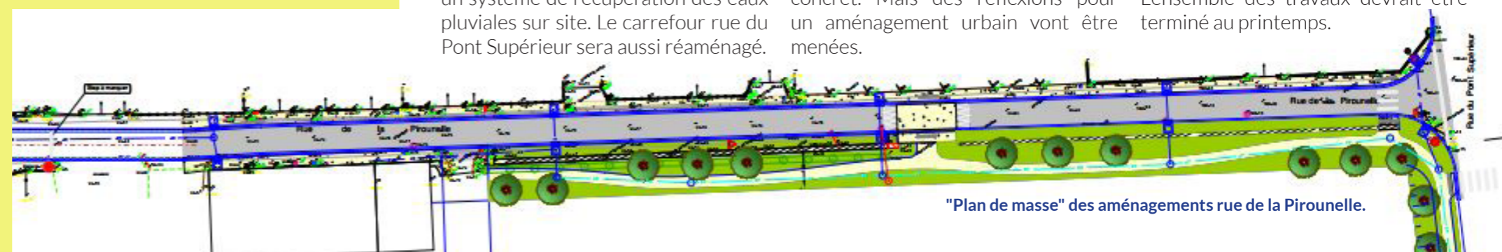
"Plan de masse" des aménagements rue de la Pirounelle.

L'ensemble des travaux devrait être terminé au printemps.