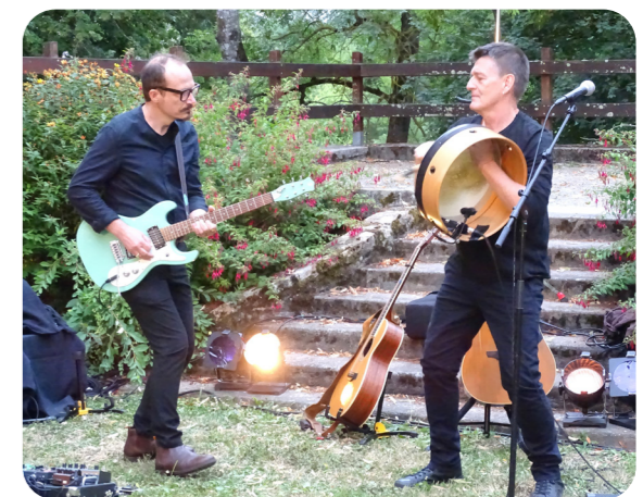
Concert de L'arbre bleu au Théâtre de verdure, le 30 juin. (organisé par la Médiathèque).

Les expositions au Château de Javarzay ont été également un rendez-vous attendu et apprécié par les visiteurs : peinture, dessins, photographies, sculptures portées par des artistes généreux, ont séduit les Chef-Boutonnais et les touristes. L'exposition des 40 ème Journées du patrimoine portée par les Amis du Château autour des "génies créatifs", a mis en lumière le patrimoine du savoir-faire local et permis aux visiteurs de passer un agréable moment riche en souvenirs.