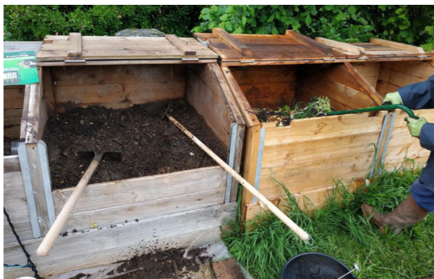
Exemple de composteurs collectif.

La Communauté de communes "Mellois en Poitou", en charge de la gestion des déchets, mène une réflexion en ce sens. Vous serez bientôt informés de ses décisions.