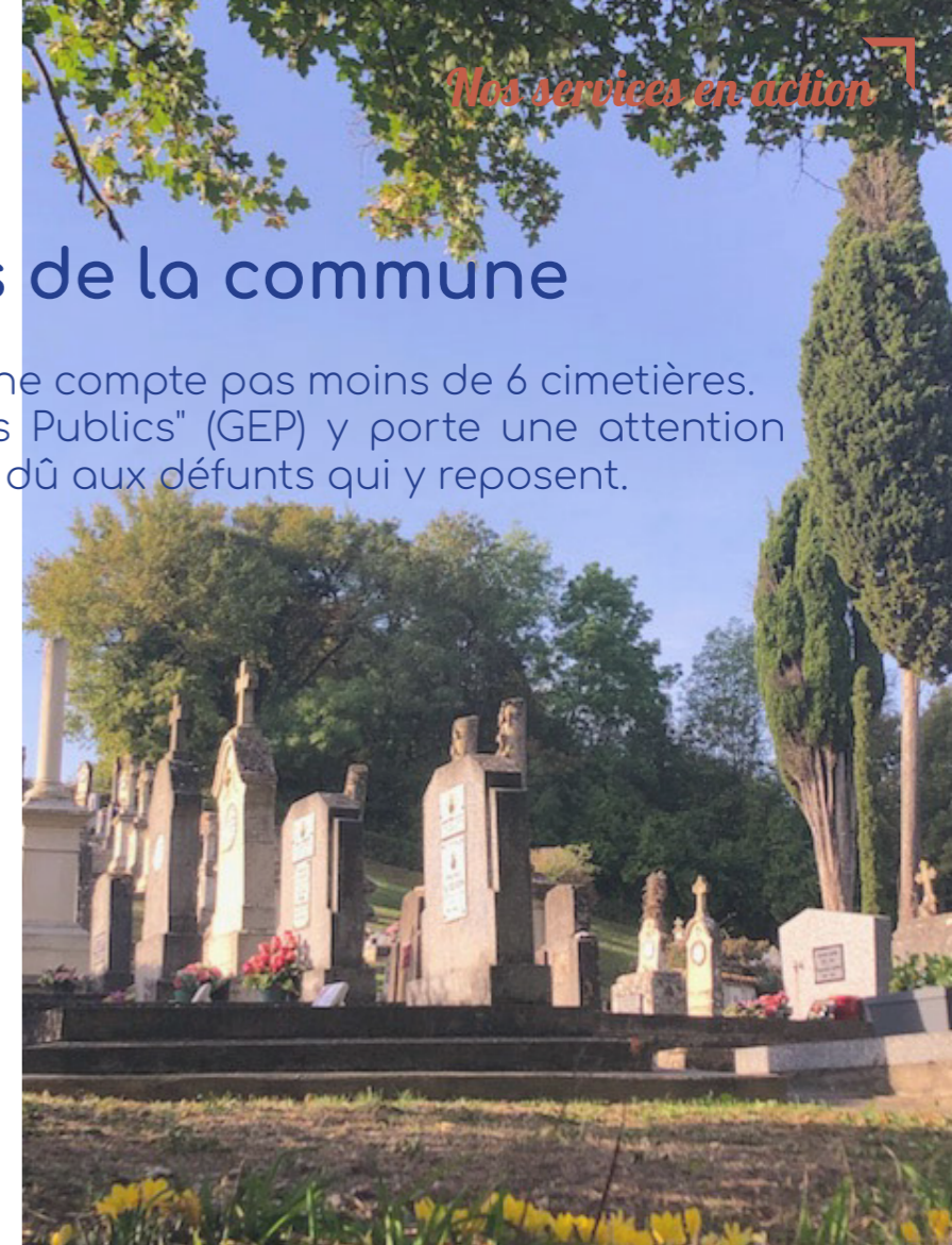
Le cimetière végétalisé de Crézières : le plus atypique des 6 que compte notre commune.

Avant chaque sépulture et par respect pour la famille, l'équipe assure au mieux le nettoyage autour du périmètre de la tombe, voire plus si possible.