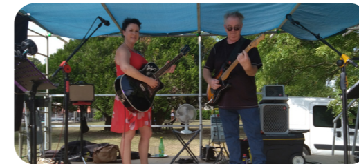
Le groupe McKenzie, invité du "Musique au Jardin" au Logis de Lussais, le 16 août.