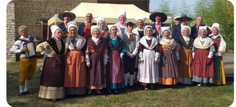
"Les Amis du Vieux Poitou", Vie de Villages et de Quartiers à La Bataille, le 8 juillet.

Côté Vies de Villages et de Quartiers , ces rendez-vous "au plus près des habitants" voulus par la Municipalité et concoctés depuis 3 ans en partenariats avec les associations communales, le programme fût riche : fête animée avec danses folkloriques, balades contées et musicales sur la vie des communes, marché de producteurs et atelier de fabrication de pains... Ces propositions variées ont fait la joie tant des participants que des organisateurs. Tout comme les concerts proposés à ces occasions : du musette au disco, du jazz-swing au pop-rock, il y en a eu pour tous les goûts !