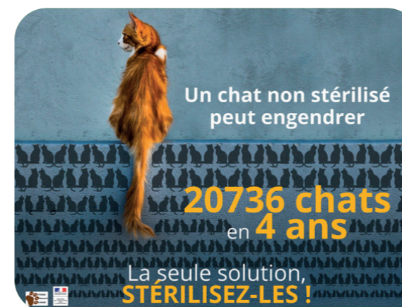
© illustration : ACTIONS ANIMAUX GUYANE / DAAF.

► Les chiens doivent être tenus en laisse sur tout l'espace public. En cas de chiens errants, les frais de capture et d'hébergement, voire de puçage (obligatoire depuis le 6 janvier 1999, sous peine d'amende de 750 €), en fourrière animale, seront à votre charge. Pour information, la fourrière communale est déléguée à Animal'Or à Mairé-L'Evescault.