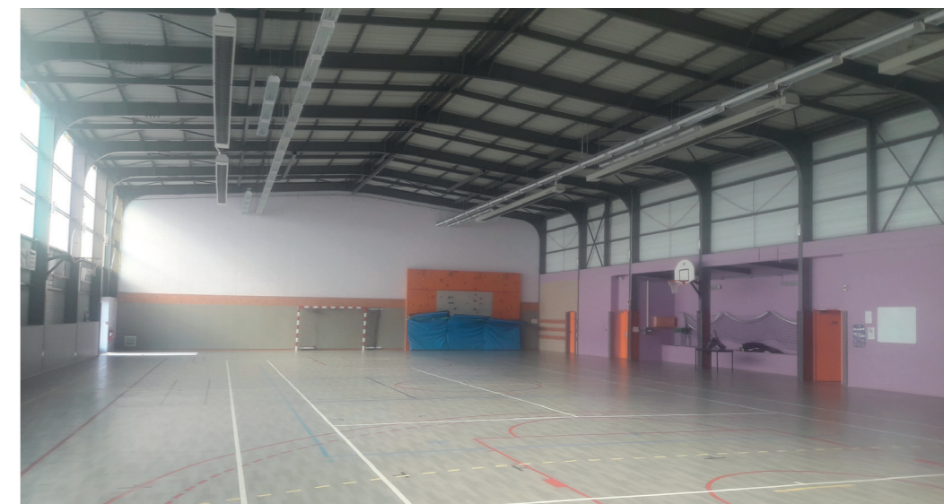
Le gymnase est un équipement essentiel à la vie associative.

Nos motivations n'étaient pas financières, puisque les dépenses de