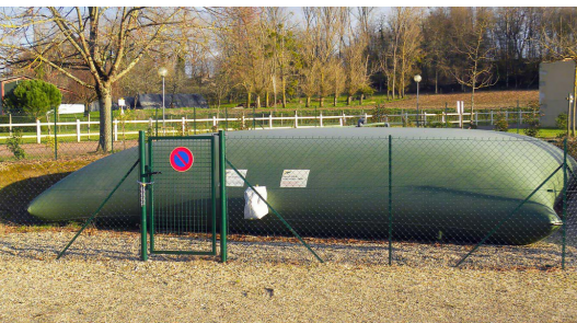
Une outre comme celle-ci peut stocker 60m 3 d'eau pour la défense incendie.

Responsable de la DECI (Défense Extérieure Contre l'Incendie), la commune est tenue de mettre en place les moyens de défense contre ces risques. En collaboration avec le SDIS 79, la municipalité a donc élaboré un plan de défense incendie. Ce travail, mené depuis 2017, matérialise et répartit, sur tout le territoire, nos installations de protection.