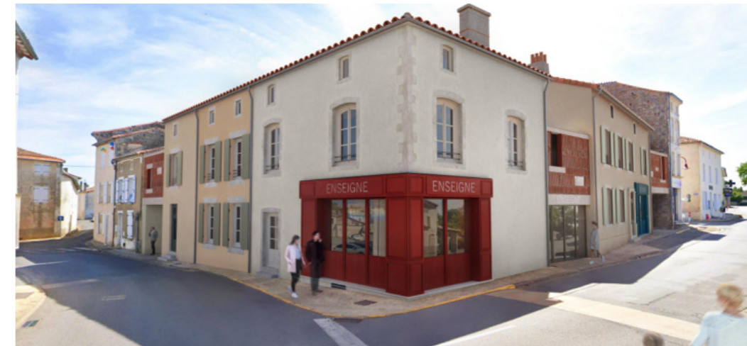
Fin des travaux escomptée en septembre 2024 pour cette réhabilitation d'un îlot urbain à enjeux forts pour la commune. © Vue architecte Atelier du Trait - Mairie Chef-Boutonne.

Après la fermeture, en 2017, de la boulangerie située à l'angle de la rue du commerce et de la place Cail, les élus ont souhaité profiter de la vente de l'immeuble voisin, maison de la famille Coirier, pour mener une réflexion d'ensemble. Les élus ont émis l'idée que le renforcement du commerce dans la commune ne serait possible qu'en centre-ville, avec des cellules commerciales accessibles et conçues aux normes actuelles.