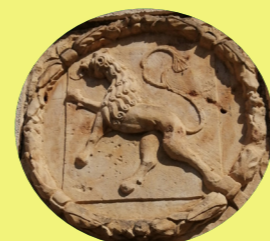
"La pierre du Lion" : mystérieuses armoiries sur le Moulin des Bessons...

Depuis le Moyen Âge, les rues sont nommées d'après leur situation, leur destination ou les personnes qui y ont vécu ou travaillé. Par exemple, saviez-vous que la Place Pré doit son nom à un médecin généreux qui a offert son terrain pour y faire un marché aux moutons ? Ou que la Rue des Bessons vient d'un ancien moulin à deux roues (bessons = jumeaux) qui appartenait au seigneur du coin ? Ou encore que la Place du Petit Maure et le carrefour de la Tête Noire font référence à d'anciennes auberges ? Il y a aussi la Croix-Perrine , un lieu de charité pour les pauvres et les pèlerins, la Place Emile-Thomas , un ancien gendarme héroïque pendant la guerre, et la Rue Henri Héliot , un médecin philanthrope. Et ce ne sont que quelques exemples !