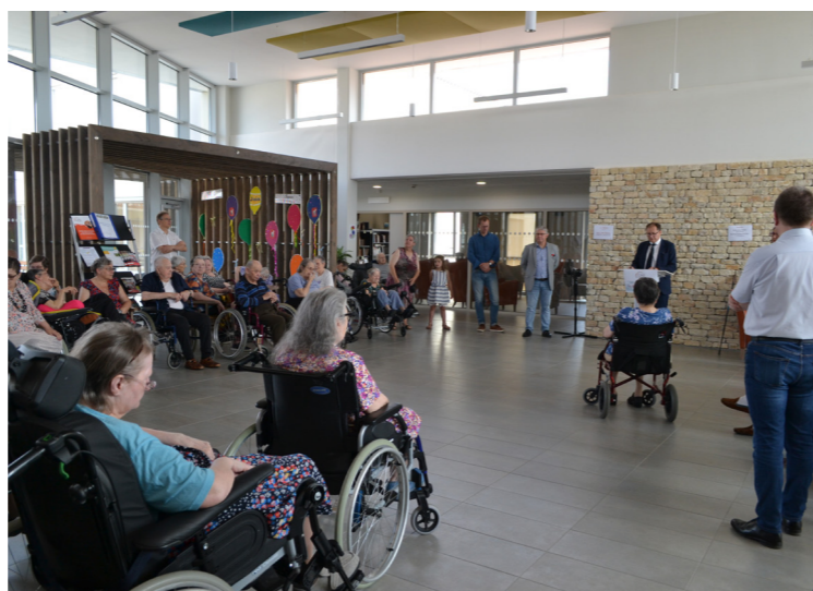
L'inauguration officielle, le 17 juin, en présence des résidents et familles, fut pour tous un moment de grande convivialité.

D'un coût de 11 300 000 € TTC, cet établissement répond parfaitement aux attentes des résidents et agents qui apprécient ce nouveau lieu de vie, agréable et fonctionnel.