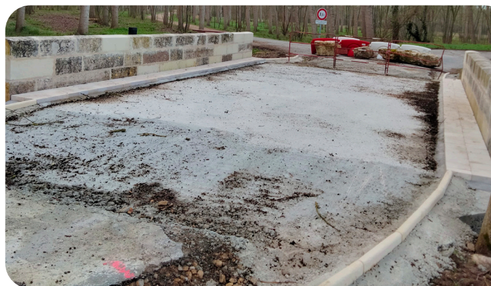
Le pont de Lussais pendant les travaux.

La qualité des travaux effectuée montre le savoir-faire de nos agents que nous tenons à souligner. Dans quelques jours, le pont sera ouvert à la circulation, pour le bien-être de chacun.