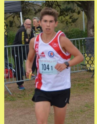
Une passion pour la course de fond née du confinement.

De son village, il aime les côtes pour s'entraîner et particulièrement celle de la rue du Royou. Il serait heureux de partager ses foulées avec d'autres coureurs, tillolais ou Chef-Boutonnais. Avis aux amateurs !