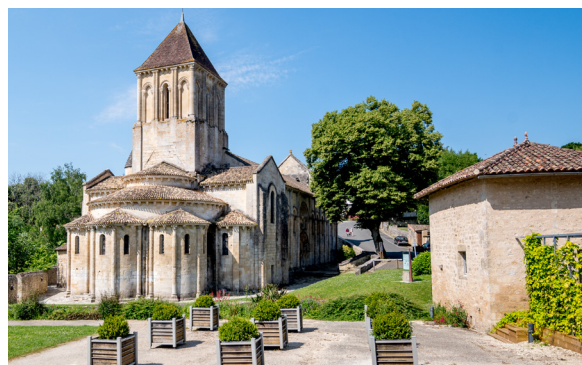
L’Église Saint-Hilaire, classée au Patrimoine mondial de l’Unesco, s’ouvre sur les chemins de la découverte...

Melle est une ville à l’échelle humaine, familiale et accueillante qui gagne à être découverte.