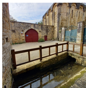
Un magnifique village à découvrir au fil de l'eau.