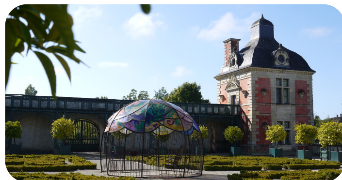
Amateurs d’art ou de botanique : l’Orangerie se visite pour ses expositions et son jardin aux agrumes...

Cette cité est un hymne à l’union : celle de La Mothe et de Saint-Héray, de la Sèvre et de la forêt, de la Rosière et de son époux, et maintenant celle de la tomme de chèvre et des truffes. Les sentiers balisés relient, à pied ou à vélo, l’Orangerie au Moulin l’Abbé via les bords de Sèvre ou le parc boisé et ses belvédères.