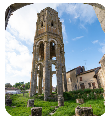
La Tour Charlemagne : un vestige impressionnant dans l'abbaye.

Découvrez Charroux, ancienne capitale médiévale du Comté de la Marche. Nommée Petite Cité de Caractère en 2017 et étape sur le chemin de Saint-Jacques-de-Compostelle, la cité offre un patrimoine médiéval exceptionnel : l'abbaye Saint-Sauveur, sa tour-lanterne et sa statuaire, des maisons à pans de bois, des halles du XVI ème siècle, la porte de l'Aumônerie, ancienne entrée principale de l'Abbaye et de nombreuses caves.