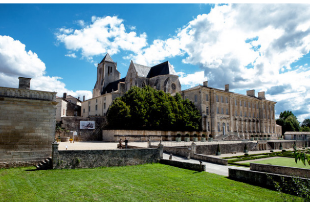
Flânez dans les jardins de l’abbaye, découvrez son musée des motos rétros ou partez en randonnées !

➕ Moulin L’Abbé : 05 49 05 19 19 / moulin-labbe.fr Mairie : 05 49 05 01 41 / la-mothe-saint-heray.fr