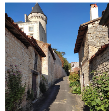
Venelles fleuries par les habitants.

✚ Mairie : 05 45 31 42 05 / www.verteuil-charente.fr