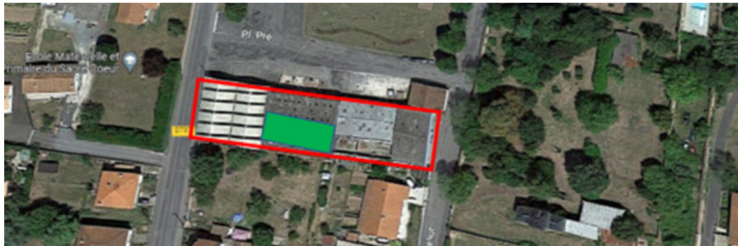
Localisation du projet photovoltaïque (en vert) sur le toit des services techniques (en rouge).

Aujourd'hui, nous souhaitons aller plus loin avec 2 actions fortes : des panneaux photovoltaïques sur l'atelier des services techniques et un changement de chauffage dans 2 bâtiments municipaux.