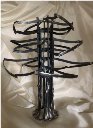
La maquette de la sculpture réalisée par Max Quiard et les Copains de l'enclume.

Le conseil municipal, sur proposition de l'équipe éducative, a opté pour "l'École du Grand Cèdre" comme nouveau nom du groupe scolaire.