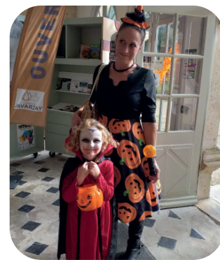
31/10 : Charmantes participantes au jeu de piste d'Halloween.