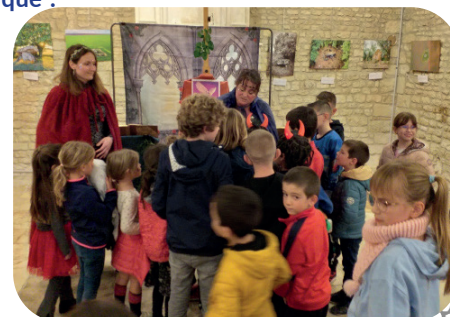
30/10 : les Fées de la Médiathèque ont enthousiasmé leur jeune auditoire...