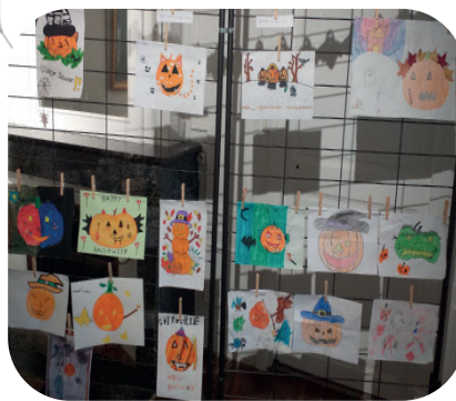
Concours de dessins Halloween 2023.