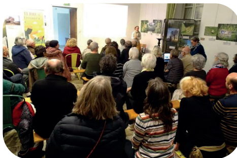
28/10 : Conférence sur Mélusine, proposée par la Médiathèque.