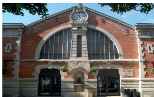
Façade du Centre Culturel