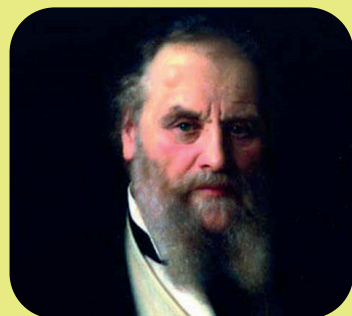
ARISTIDE BOUCICAUT 1810-1877

Le premier à lancer cette opération fut Aristide Boucicaut , le fondateur du célèbre magasin "Au Bon Marché" en 1852. Il fut rapidement suivi par ses rivaux.