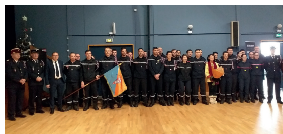
L'ensemble des effectifs du Centre de secours de Chef-Boutonne.

Vendredi 5 janvier à 19h, au Centre de Secours de Chef-Boutonne, aura lieu la traditionnelle Sainte-Barbe (Patronne des Sapeurs-pompiers en France).