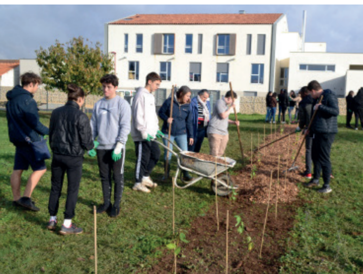
Pruneliers, noisetiers, cournouillers... Une centaine de jeunes plants d'essences locales ont été installés. Merci aux lycéens !