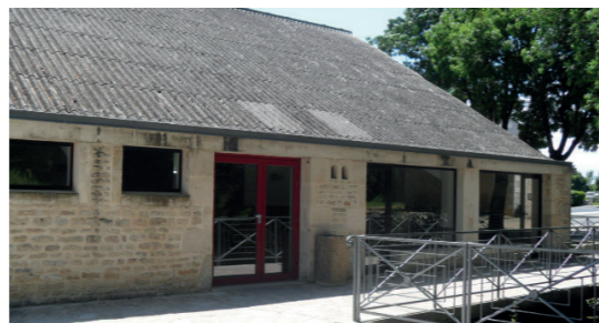
La salle Raymond Quiard à Javarzay

Les travaux du Centre Culturel qui auront lieu de juin à début septembre ne vont que très peu perturber l'utilisation des différentes salles, compte tenu du type de travaux et de leur localisation. En revanche, la salle R. Quiard sera totalement inutilisable du début septembre jusqu'à la fin de l'année 2024 . En effet, nous allons en profiter pour entreprendre des travaux complémentaires (toilettes, sol de la salle...).