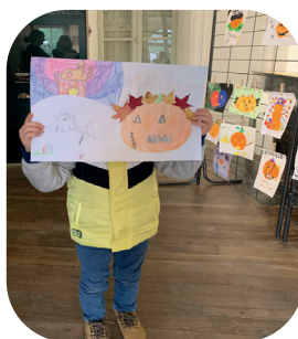
Un des gagnants du concours de dessins, sur le thème : "La citrouille magique".