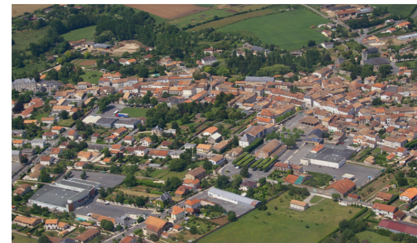
Notre commune compte plus de 120 logements vacants.

Notre commune connaît un taux de logements vides assez important, avec plus de 120 immeubles identifiés. Parallèlement, nous connaissons une pénurie importante de logements locatifs. Cette situation anormale devient donc un paradoxe. La décision de mettre en place une fiscalité pour ces immeubles (voir modalités ci-dessous) vise à inciter les propriétaires à ne plus laisser leurs immeubles vides et à les rénover ou les remettre sur le marché de la vente ou de la location. Cette mesure, récente, qui a été mise en place aussi dans d'autres communes « Petites Villes de Demain » comme Melle, Sauzé-Vaussais, commence à produire des effets, avec une diminution de la vacance.