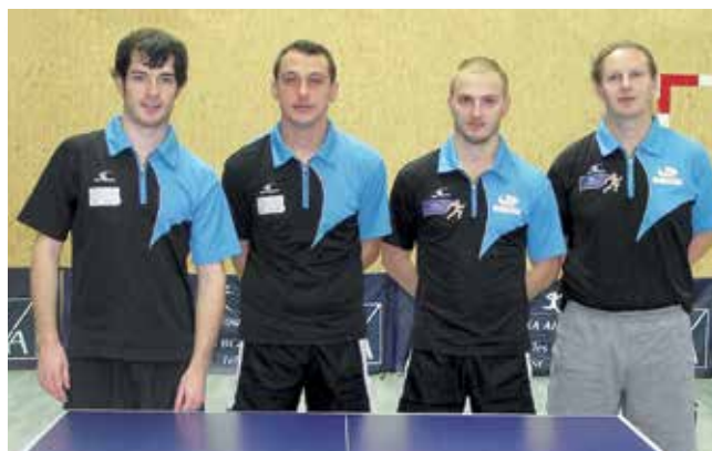
Equipe N2 (2013-2014)