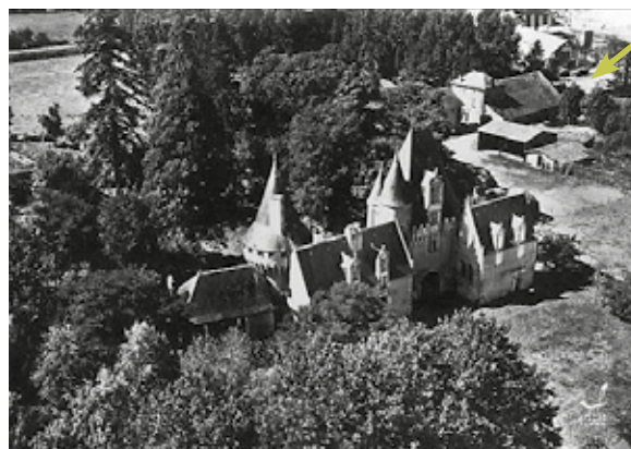
La ferme du château

N'hésitez pas à contacter la mairie au 05 49 29 80 04 pour tous renseignements sur les disponibilités et les tarifs de réservation de ce lieu de convivialité.