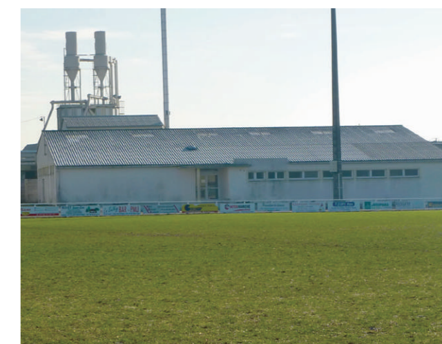
Salle du tennis de table