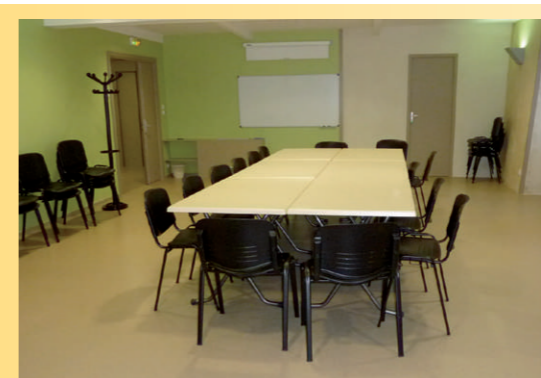
Salle des Sources